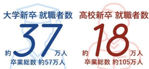
高校新卒求人人数推移